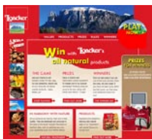
Il contest è destinato al mercato Usa