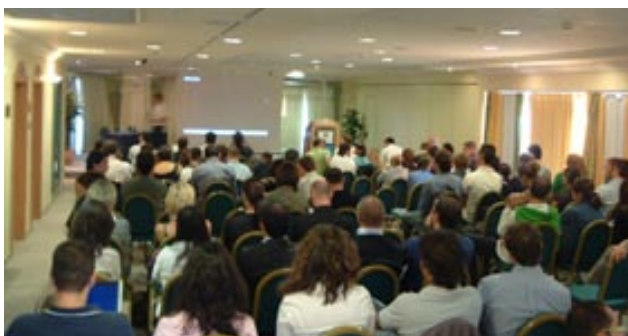
La Convention Tiscali si è tenuta a Villasimius, in provincia di Cagliari

NUOVO PORTALE TISCALI.IT, SOCIAL NETWORK PERSONALIZZABILE WILLAGE E PRESTO ANCHE L'INGRESSO NEL MERCATO MOBILE 4-5-6